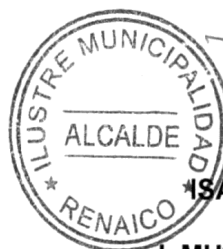
ISABEL MORALES URRRA ALCALDESA I. MUNICIPALIDAD DE RENAICO